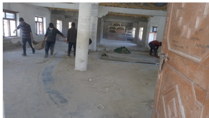
Les parents d'élèves participent au chantier dans le cadre des heures four-nies pour l'entretien du campus