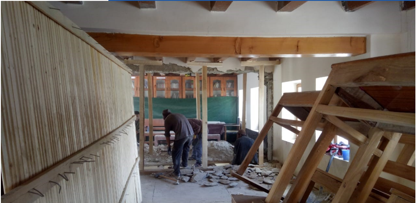
Travaux d'agrandissement d'une salle de classe pendant l'été 2020