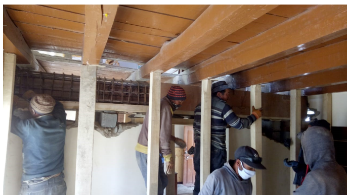
Une nouvelle poutre porteuse est ferrailée avant d'être coffrée et bétonnée