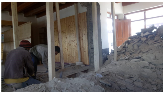
Tas de gravats après abattage du mur de séparation... les murs sont épais !

Le Managing Committee profite de la fermeture forcée de l'école pour cause de covid-19 pour réaliser des travaux d'envergure sur le campus. Au programme : l'aménagement du laboratoire ainsi que l'agrandissement d'une salle de classe dans le Main Building afin de se mettre aux nouvelles normes de surfaces imposées par le gouvernement. Sur les quelques images qui nous sont parvenues depuis le Zanskar on peut voir les différentes étapes qui ont nécessité l'abattement d'un mur porteur entre deux classes existantes.