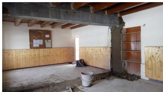
La nouvelle salle de classe, aux nouvelles normes

Retrouvez plus d'images et des vidéos du chantier sur notre site : https://www.aaz-ch.org/travaux-ete-2020-a-la-lmhs/